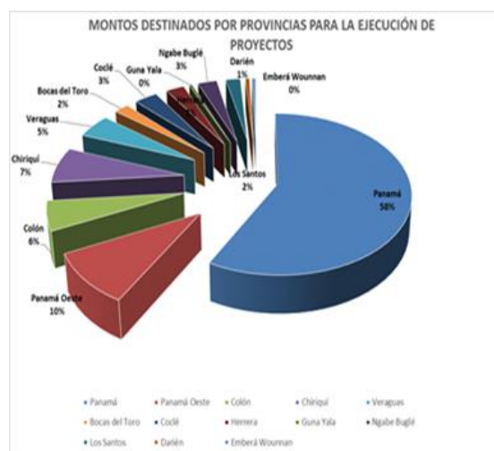
Gráfico 1. Porcentaje de los montos destinado para la ejecución de proyectos