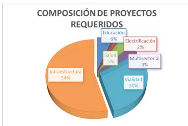
Gráfico 2. Porcentaje de proyectos solicitado según diversos rubros.

Según datos de SND los proyectos solicitados están divididos en los siguientes sectores.