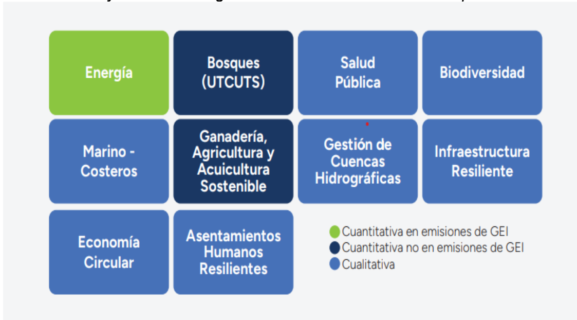
Diez sectores y áreas estratégicas de la Economía Panameña para la Acción Climática