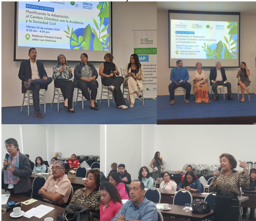
Figura 1. Participación de investigadores del Centro de investigaciones de la Facultad de Economía y Actores claves en el Proyecto NAP Panamá

Entre sus acciones planificadas están los foros regionales para sensibilizar a