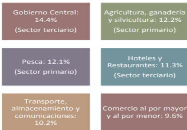
Sectores Económicos en la Provincia de Coclé