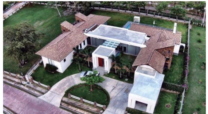
Figura 4. Villa Lucía. Punta Barco, Panamá.

Su fachada principal tiene un muro de piedra interrumpido por un cubo que cumple función de vestíbulo. Al abrir la puerta, nos sorprende un puente sobre un espejo de agua con jardín a ambos lados, muy similar al del patio de Acequia que tanto admiraba Salmona. Este espacio abierto conduce al área social de la vivienda que permite visualizar toda la casa. Su planta tiene forma de "H", el área privada se encuentra en el ala izquierda, el área social en el centro y las áreas de servicio en el ala derecha. Siguiendo el recorrido central y dando continuidad a los espejos de agua de la entrada, llegamos a la piscina. [15] Está ubicada en la parte posterior y a nivel del suelo al igual que en la casa de García Márquez.