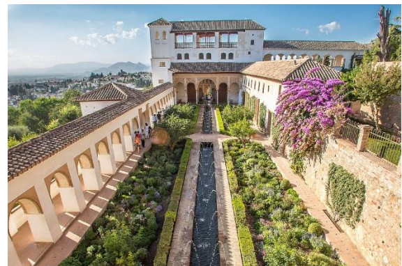
Figura 3. Patio de Acequia, Generalife. Granada, España.

Sus principales influencias, consideradas como un método de aprendizaje e instrumento para proyectar arquitectura, son sus viajes. Descubrió gracias a su maestro Pierre Francastel (historiador y crítico del arte), la importancia del estudio de la historia y la tradición de las culturas que conoció en muchos países. En España, fue cautivado por la Alhambra de Granada y desde ese momento la arquitectura islámica marcó su vida. Por más de un mes y medio, sin dinero para seguir, tuvo que quedarse en ese sitio. No había un día que no fuera a contemplar el Generalife o la Alhambra mientras dibujaba. [11] El Generalife, que significa “Jardín del arquitecto”, es una villa con jardines construida entre el Siglo XII y XIV. Era utilizada por los reyes musulmanes de Granada como lugar de retiro y descanso, pero su arquitectura parecía más una casa de campo que un palacio. Sus jardines ornamentales, huertos y arquitectura se integraban, siendo uno de sus principales patios el de Acequia. [13] (Ver figura 3.) La casa de García Márquez fue claramente influida por estas ideas y del Generalife se inspiró para incorporar el agua en sus proyectos.