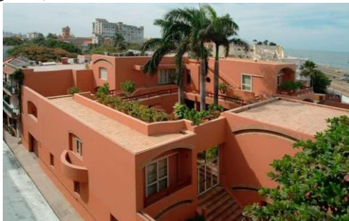
Figura 2. Casa Gabriel García Márquez.

La obra de Rogelio Salmona se caracteriza por el uso abundante del ladrillo en todo el conjunto, dándole un aspecto macizo a la casa y brindando una sensación de solidez. [9] En las fachadas podemos observar como este ladrillo ha sido cubierto con mortero y posteriormente pintado en un color terracota, logrando un contraste con el azul del cielo y el mar. (Ver figura 2)