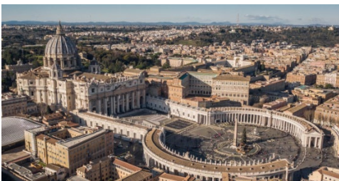
Figura 1. Vista aérea de la Plaza de San Pedro [6].

Para la construcción del circo se transportó un obelisco de Egipto a Roma, que hoy es el punto focal de la Plaza. La posición original del obelisco está señalada cerca de la sacristía de la Basílica. El movimiento del obelisco tuvo que efectuarse bajo las órdenes del Papa, entre ellas se conoce que nadie podía hacer ruido alguno para mantener concentrados y coordinados a quienes realizaron la hazaña, quien hiciese el más mínimo ruido sería excomulgado [5].