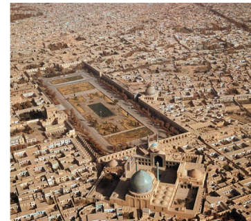
Figura 3. Vista aérea Plaza Naqsh-e Yahán, por Mario De Biasi [16].

Ya teniendo un punto comercial establecido, se opta por desviar la Ruta de Seda hacia Isfahán para aprovechar el comercio. Fue construida entre 1611 y 1629. Este sitio albergó múltiples celebraciones persas, entre ellas destaca el año nuevo persa (Nowruz), también ocurrieron ejecuciones públicas, juegos de polo y desfiles del ejército [12]. Ver figura 3.