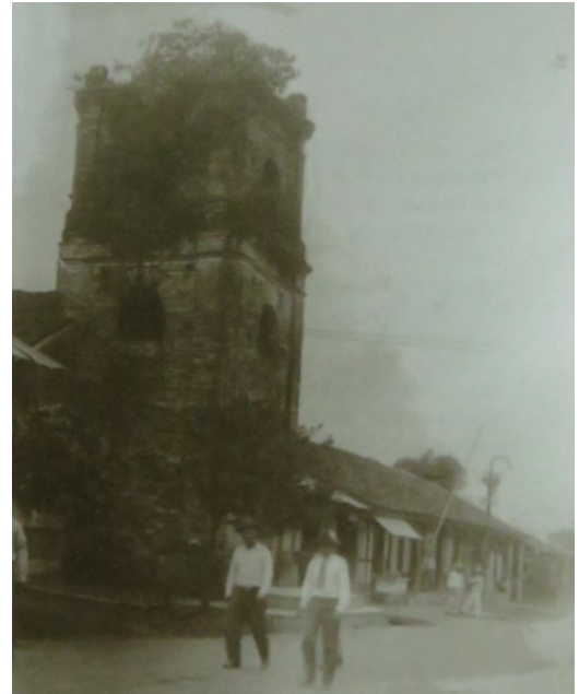
Ilustración 4. Fotografía de la Iglesia de San Juan De Dios, frente a la Placita del mismo nombre, demolida en 1938.

Para esta fecha, este mismo inmueble albergaba “ El Asilo de Ancianos ”. La Iglesia se mantenía en ruinas y la que había pasado a ser la Iglesia principal de la ciudad es la actual Iglesia Santiago Apóstol, desde el Siglo XIX.