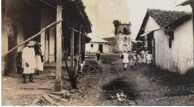
Ilustración 5., Placita San Juan de Dios, Santiago de Veraguas al fondo la iglesia del mismo nombre (antes de 1938). Esa calle en la época colonial se conoció como Calle de los Artesanos pues se dirigía a la parte posterior dónde quedaba la plazuela de San Antonio ( hoy desaparecida).

mantienen en pie. Hoy día ubicada en donde hoy se encuentra la Cooperativa Juan XXIII y la actual Biblioteca Pública.