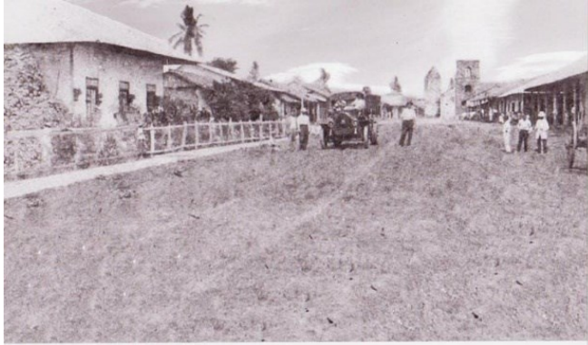
Ilustración 3. Foto de la ciudad de Santiago de Veraguas de 1924, al fondo a mano derecha se observa la torre de la Iglesia San Juan de Dios.

para la Real Hacienda . Propone instalarlo en el Hospital de Santiago (San Juan de Dios) al lado de la Iglesia con el mismo nombre) donde informa que faltan enfermos y el edificio se está deteriorando por la falta de uso. Este dato nos indica que desde finales de Siglo XVIII, ya la iglesia y el Hospital estaban deterioradas. [17] pp. 351