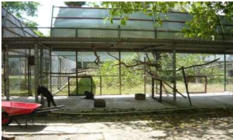
Fig. 3. Ubicación Física de los primates (Primate: Ateles .) en el Parque Summit

El estudio se llevó a cabo con dos individuos (hembra y macho) de edades que oscilan entre 15 a 20 años (Dra. Diorenne Smith comunicación personal), de las especie Ateles geoffroyi panamensis y Ateles fusciceps robustus , ubicados en cautiverio en el Parque Municipal Summit. Los ejemplares estaban ubicados en jaulas de 355.60 cms x 177.80 cms, con un área de trampa de 129.54 cms y un anexo de 160.02 x 129.54 x 114.30 cms (Figura 3).