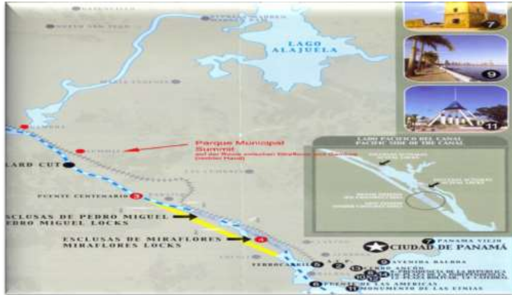
Figura.1. Ubicación del Parque Municipal Summit, distrito de Panamá.