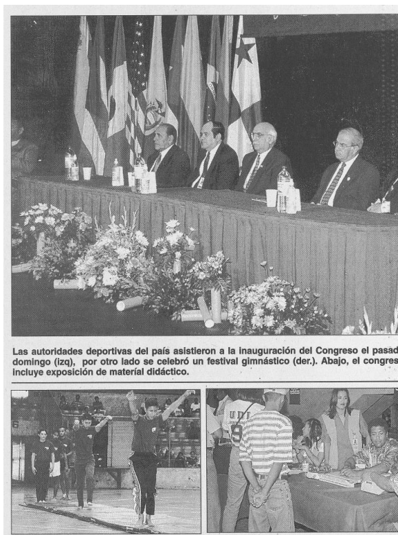
Las autoridades deportivas del país asistieron a la inauguración del Congreso el pasado domingo (izq), por otro lado se celebró un festival gimnástico (der.). Abajo, el congreso incluye exposición de material didáctico.