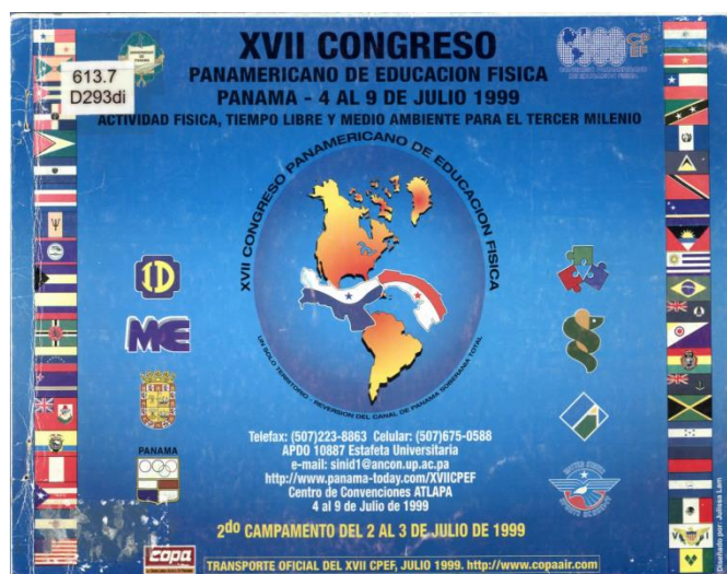
Figura 2. Logo del XVII Congreso Panamericano de Educación Física