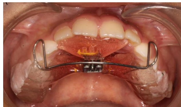
Fig. 13 Vista frontal del aparato de Eschler Fig. 14 Vista de 45° con el aparato de Eschler

El arco de Eschler con tornillo triple debe usarse entre 18 y 20 horas diarias, incluyendo durante el sueño, y retirarse solo para comer, cepillarse y hacer deporte. Debe limpiarse a diario con cepillo suave y jabón neutro o pasta dental, y guardarse en su caja rígida cuando no se use. No debe mojarse con agua caliente ni dejarse al sol.