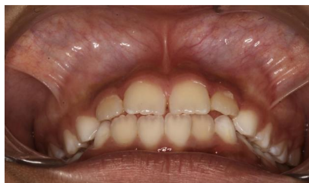
Fig. 16 Intraoral de 45° final