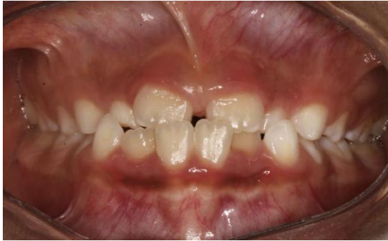
Fig.3 Fotografía intraoral de frente

cruzada anterior con apiñamiento en el sector anteroinferior. En el arco superior se observa un diastema entre los incisivos centrales superiores permanentes, también se observa que estos dientes están ligeramente rotados. La relación molar de ambos lados es de clase III y la relación de los caninos deciduos también es de clase III.