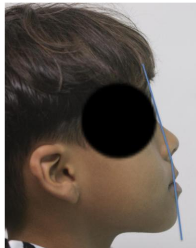
Figura 2. Perfil del paciente

Análisis intraoral: Al observar la boca del paciente nos encontramos que la mucosa está húmeda y lubricada con pigmentación melánica, el frenillo es de inserción mucosa; hay poca inflamación de las encías. El paladar duro es profundo. El paciente está en dentición mixta, existe una mordida