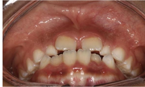
Fig. 4 Fotografía intraoral de 45°