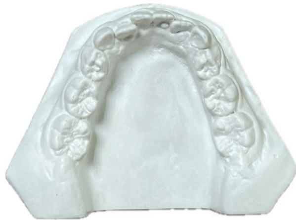
Fig. 8 Modelo inferior es una vista oclusal