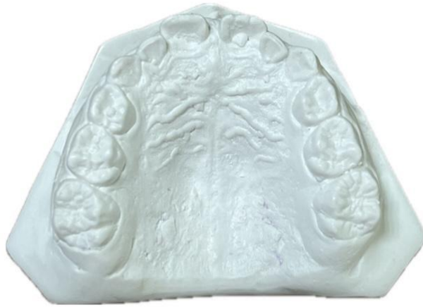
Fig. 7 Modelo superior en una vista oclusal

Análisis de los modelos: El arco superior tiene forma de U. El arco inferior tiene más una forma rectangular y en la vista oclusal, se confirma el apiñamiento de los incisivos inferiores permanentes. La discrepancia en el arco superior nos dio de -1.2 mm y en el arco inferior fue de -2mm.