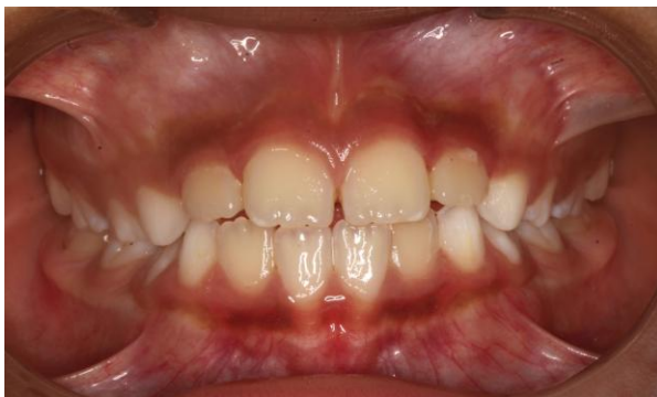
Fig. 15 Intraoral de frente final

Luego de 9 meses se logra expandir el maxilar superior y protruir los incisivos superiores, eliminando la mordida cruzada anterior.