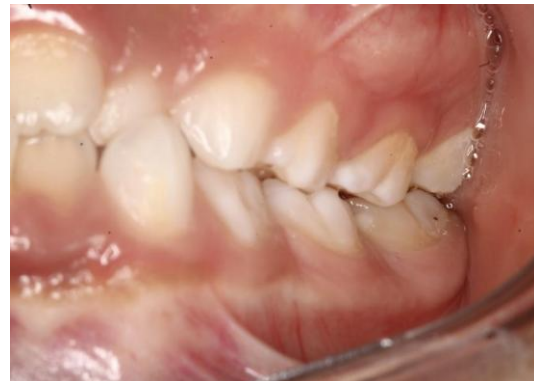
Fig. 6 Fotografía intraoral lado izquierdo