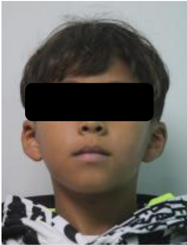
Figura 1. Extraoral de frente

Los tercios faciales muestran diferencias en longitud (25 mm, 30 mm y 58 mm), mientras que los quintos faciales son simétricos. Se observa mentón prominente, nariz mesorrina y perfil convexo, acompañado de ojos de forma almendrada.