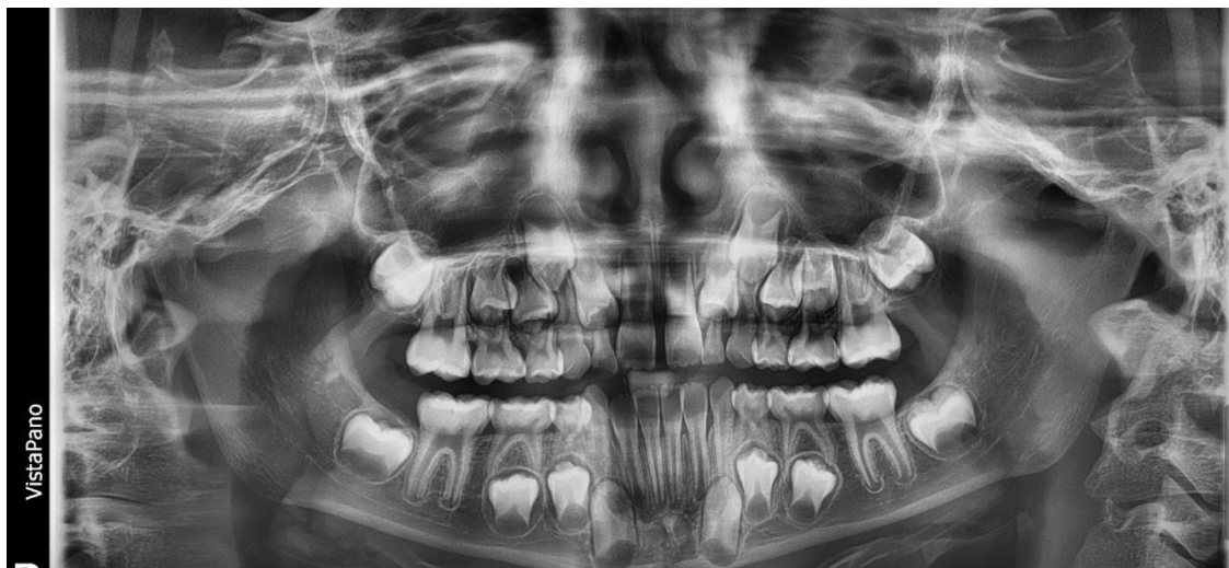
Fig. 10 Radiografía Panorámica inicial

Las radiografías periapicales y la panorámica mostraron un desarrollo dental de un paciente de 7 años. (Fig. 10, 11 y 12)