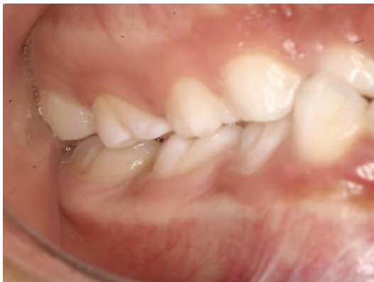
Fig. 5 Fotografía intraoral lado derecho