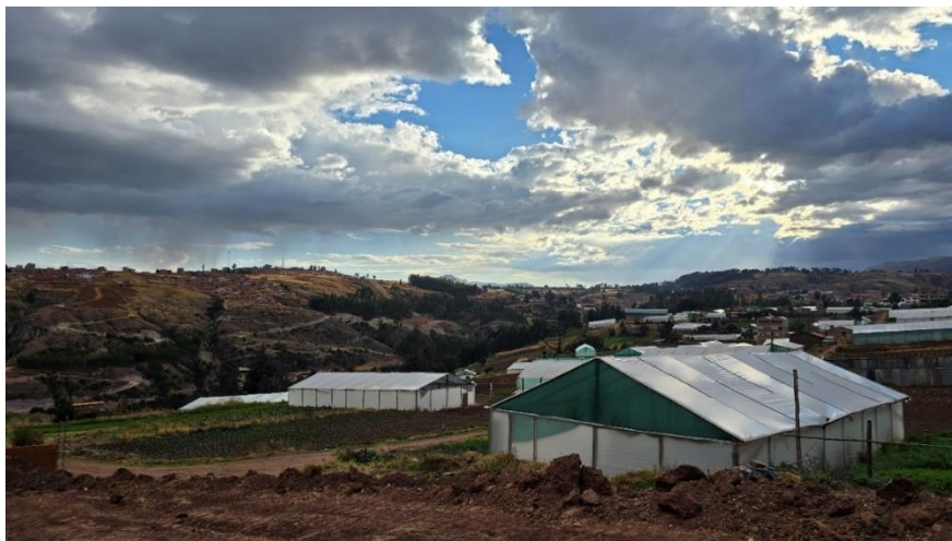
Nota: Fotografía panorámica de la comunidad campesina de Pumamarca, distrito de San Sebastián, Cusco, Perú.