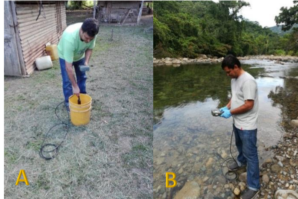
Figura 4. A. Lectura de parámetros fisicoquímicos en agua de pozo utilizando la sonda multiparamétrica. B. Lectura de parámetros fisicoquímicos del agua, utilizando la sonda multiparamétrica en el río Bajo Güera

Lectura del agua en los ríos: la sonda multiparamétrica se colocaba dentro del cauce del río, asegurándose de un flujo o corriente continua de agua, evitando remanses; una vez estabilizados los valores se procedía a la lectura de los datos (Figura 4B).