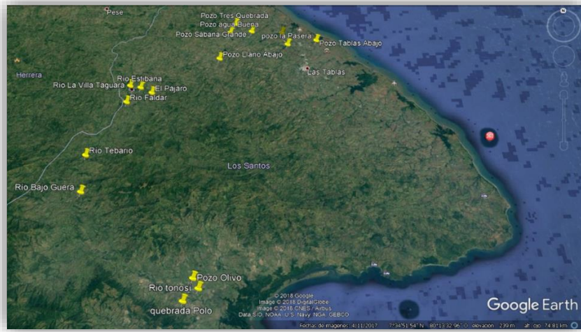
Figura 1. Ubicación de ríos y pozos, en el área de investigación, de la provincia de Los Santos.

Los Santos: un pozo (1) en Sabana Grande y dos (2) en Tres Quebradas. La distribución de los puntos de muestreo se indica en la Figura 1.