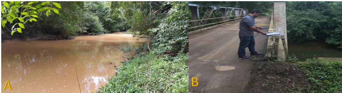
Figura 3. A. Punto de muestreo en el río Estibaná con características apropiadas para el muestreo, sin remanses con un flujo o corriente de agua sin interrupción. B. Ubicación y asignación de códigos a los puntos de muestreo, río Estibaná, distrito de Macaracas, provincia de Los Santos.

Colecta de muestra en río: las muestras se colectaron lo más próximo al centro del cauce, con flujo de agua continuo de por lo menos 15 m en línea recta; evitando los remanses del río (Figura 3A). Al envase de un (1) L se le aplicaba un enjuague vigoroso tres veces y posteriormente se extraía el volumen requerido de un (1) L, igualmente en duplicado. Para el reconocimiento de los sitios, los puntos de colecta de muestras fueron georreferenciados, e identificados con un código alfanumérico, este código recogía información de distrito, localidad, iniciales del productor, y número de muestreo o campaña (Figura 3B).