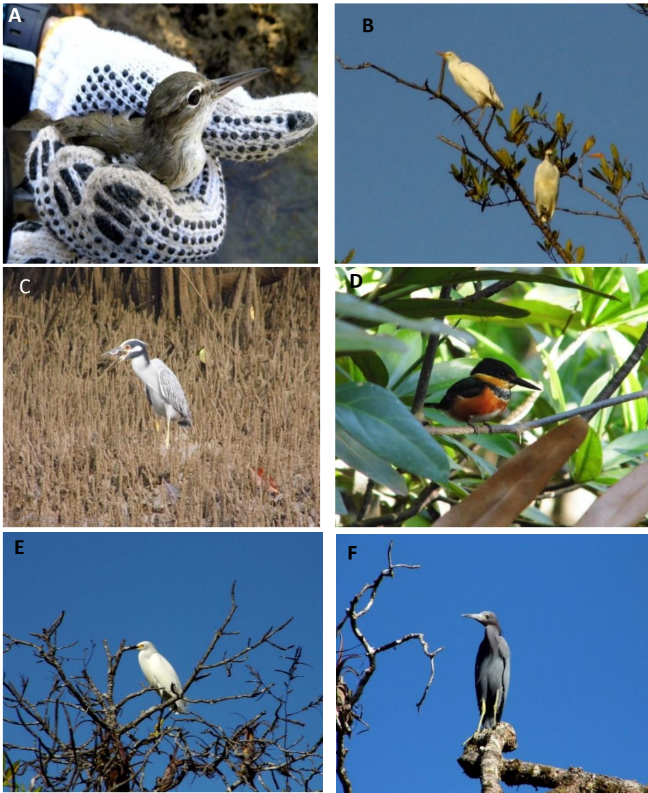
A) Playero colector ( Actitis macularius ) B) Garceta bueyera ( Bubulcus ibis ) C) Garza azul chica ( Egretta caerulea ) D) Martin pescador verde ( Chloroceryle americana ) E) Garza nocturna ( Nyctanassa violacea ) F) Garza nívea ( Egretta thula ). Fotos: Víctor García

Imágenes representativas de las aves capturadas u observadas en el manglar de Pixvae.