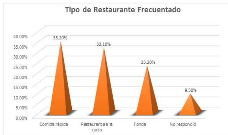
Figura 2. Tipos de restaurantes frecuentados por los encuestados

De los 225 personas encuestadas, un 9.6% dijo no comer fuera de casa, el resto comen de 1 a 6 veces fuera de casa semanalmente. La incidencia en los tipos de restaurantes es mayor en los de Comida Rápida, por lo general franquicias como McDonald y KFC, con un 35.2% que sumado a un 23.2% de los que dicen comer en fondas, representan un 58.4% de comida que son de Riesgo 3 un riesgo sociocultural para enfermedades crónicas. (Henríquez, R. et al. , 2010) (Figura 2).