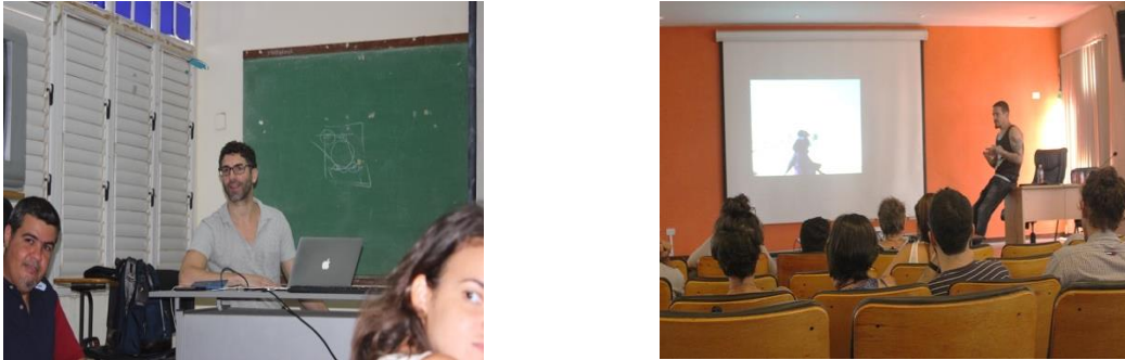
Figura 4. Vistas de talleres simultáneos en el Instituto Superior de Diseño (ISDI).