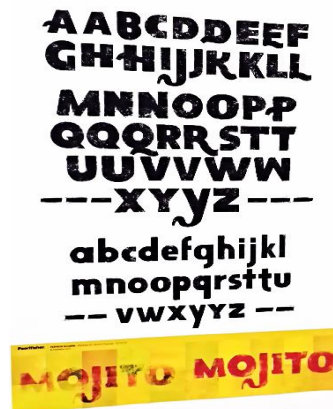
Figura 9. Muestra de carteles con creativos tipos o letras.