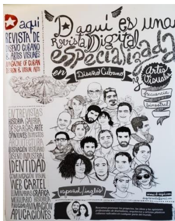
Figura 8. Diseño, uso y manejo de tipografías, en una Revista Digital Especializada de Diseño Cubano y Artes Visuales.

En el área de la moda, la creatividad y recursos utilizados en el diseño y la confección de bolsos, vestidos con temáticas especiales, joyería de gran belleza y calidad. Todas estas muestras diseñadas y realizadas por los estudiantes del ISDI (Figura 10).