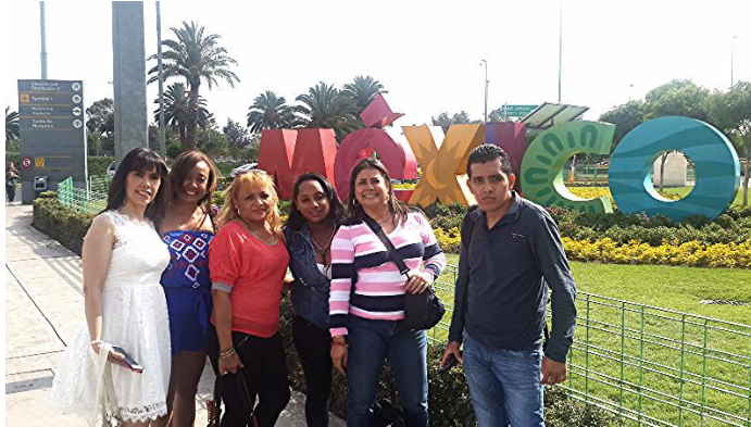
Figura 1. Delegación panameña haciendo escala en ciudad de México.

Los objetivos de la participación de la delegación panameña fueron: