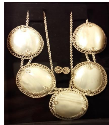
Figura 10. Diseños de joyería, área de la moda.

Durante el desarrollo de esta bienal, se logró identificar la necesidad de abordar estrategias artísticas como la oferta educativa siendo escenarios complejos, complementarios aunque igualmente autónomos, de igual manera se propusieron estrategias para lograr cambios que estimulen la sensación de generar conflictos cognitivos, cuestionar las creencias y seducir desde y en la academia. Finalmente, se discutió la postura de compartir experiencias más allá de las aulas, ya que los cambios en los actores de diseño, se dimensionan desde los procesos y no sólo con clases magistrales.