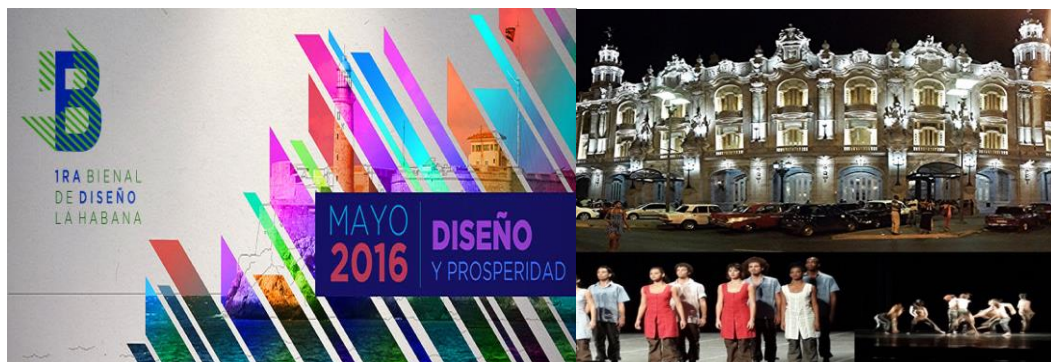
Figura 2. Logo e inauguración de la I Bienal de Diseño.

El acto inaugural de la I Bienal de Diseño se realizó el 14 de mayo a las 8:00 p.m. en el Gran Teatro Alicia Alonso de La Habana con la magistral presentación del Ballet de Danza Contemporánea de Cuba (Figura 2).