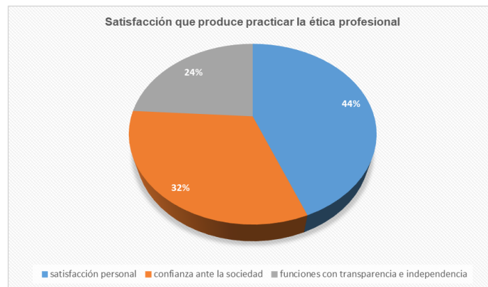
Pregunta 13, Satisfacción que produce practicar la ética profesional

La práctica de la ética profesional por auditores forenses puede valorarse como indicador de gratificación que motiva a adoptar procederes éticos por la responsabilidad laboral, así como la confianza ciudadana, pues el enfoque de las auditorías realizadas en entidades del Estado cumple con el bienestar público (Grisanti Belandría, 2016).