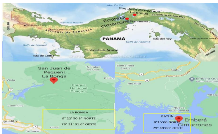
Figura 1. Ubicación de las áreas de estudio.

Los bosques de ambas áreas de estudios son bosques húmedos tropicales con una precipitación de aproximadamente 2500 mm, con una época seca que va de enero a abril y una época lluviosa de mayo a noviembre, la temperatura promedio de 26^{\circ}C y una humedad relativa de 92%.