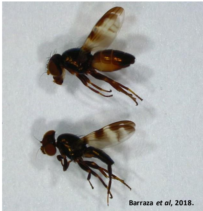
Figura 1. Euxesta mazorca colectada durante la investigación.