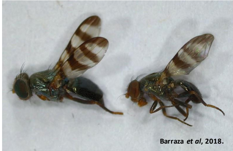
Figura 3. Euxesta stigmatias colectada durante la investigación.