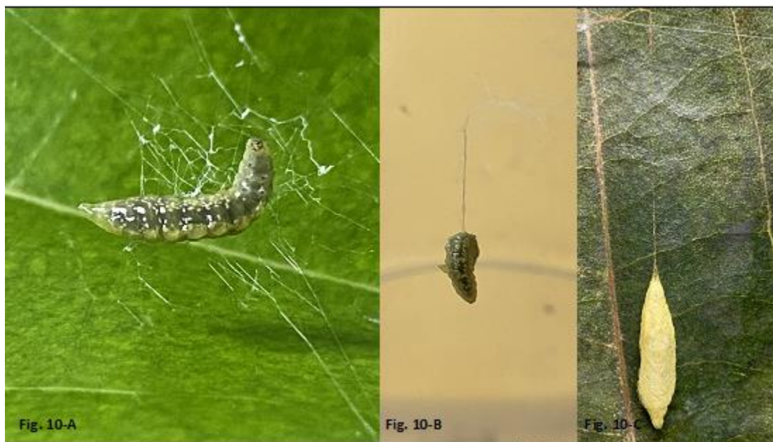
Figura 10 A. Larva de Hymenoepimecis argyraphaga despues de matar a la araña Leucauge argyra , inicia el proceso de empupar. Figura 10 B. Larva de Hymenoepimecis argyraphaga se lanza y suspende sobre la red, inicia a cerrar y construir su capullo. Figura 10 C. Capullo “Pupa” de Hymenoepimecis argyraphaga , en forma de saco con con extremos terminan en punta, el color del capullo es amarillo.

Los adultos hembra de H. argyraphaga (Figura 12), emergieron del capullo después de 10 a 13 días de haber pupado. Esta misma posición de las larvas, de la avispa parasitoide sobre el abdomen de las arañas hospedantes ya había sido observada por varios autores en varias especies de Hymenoepimecis ; H. bicolor (Brullé, 1846) sobre Nephila clavipes (Linnaeus, 1767) (Gonzaga et al., 2010), en H. japi Sobczak et al., 2009 sobre L. roseosignata Mello-Leitão, 1943 (Sobczak et al., 2009), en H. sooretama Sobczak et al., 2009 sobre Manogea porracea (Koch, 1838; Sobczak et al. 2009), y H. veranii Loffredo & Pentead-Dias, 2009 sobre Araneus orgaos Levi, 1991 en Sudamérica (Sobczak et al., 2014; Pádua et al., 2016). Se realizar ensayos en el laboratorio colocando dentro de las jaulas de malla fina, arañas L.