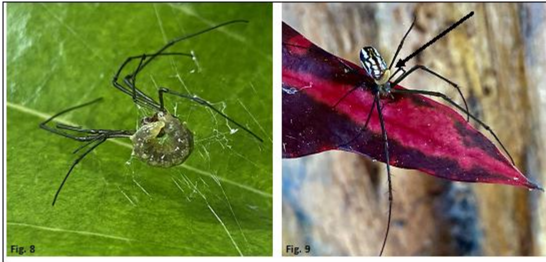
Figura 8. Larva de Hymenoepimecis argyraphaga mata a la araña Leucauge argyra .