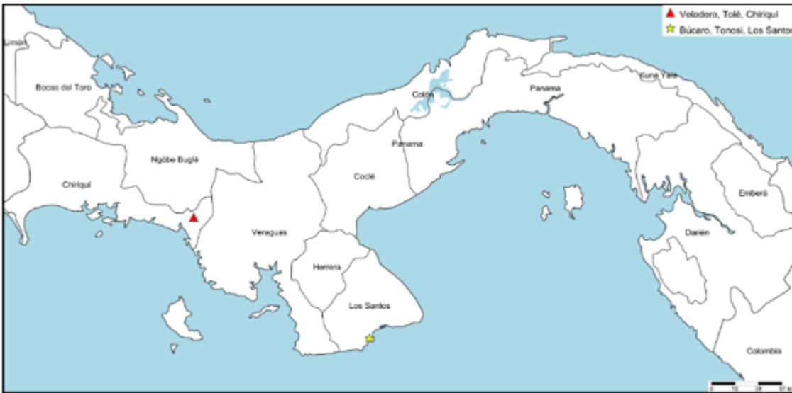
Figura 1. Sitios de colecta en la costa pacífica panameña.

Se realizaron colectas manuales, mediante red entomológica, envases plásticos, viales de vidrio con tapa a presión de 30 ml. Cada sitio de colecta fue georreferenciado con GPS. Para la colecta en el sitio Veladero, Chiriquí, se escogieron tres casas que tuvieran cultivos agrícolas de traspatio de tipo arbustivo, y se hicieron recorridos por toda la periferia e interior de los cultivos.