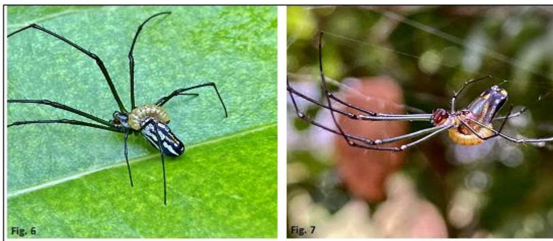
Figura 6. Araña Leucauge venusta , con larva de Hymenoepimecis argyraphaga en el dorso anterior del abdomen, larva en su ultimo estadio. Figura 7. Araña Leucauge argyra , con larva de Hymenoepimecis argyraphaga en el dorso anterior del abdomen, larva en su último estadio.

De acuerdo con los resultados y las observaciones realizadas en campo y laboratorio, se obtuvo un total 12 hembras de Hymenoepimecis argyraphaga , procedentes de cinco arañas de L. venusta (Figura 6) y de siete arañas de L. argyra (Figura 7).