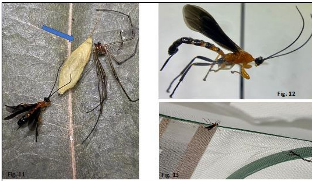
Figura 11. Adultos Hymenoepimecis argyraphaga , emergen rompiendo del capullo por la parte superior. Figura 12. Hábitus y vista lateral de Hymenoepimecis argyraphaga . Figura 13. Ensayos en el laboratorio colocando dentro de las jaulas de malla fina, arañas L. venusta y hembras de H. argyraphaga para observar el comportamiento de la araña y el parasitoide.

venusta y hembras de H. argyraphaga para observar el comportamiento de la araña y el parasitoide, y ver si la avispa parasitaba la araña, pero no se obtuvo resultados (Figura 13).