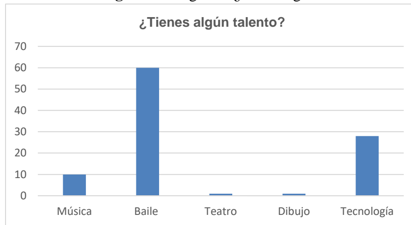
Figura 4. Pregunta: ¿Tiene algún talento?