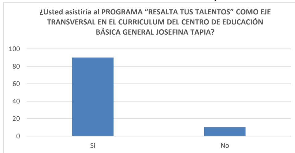
Figura 2. Pregunta: Usted asistiría al programa “resalta tus talentos” como eje transversal en el currículum del Centro de Educación Básica General Josefina Tapia