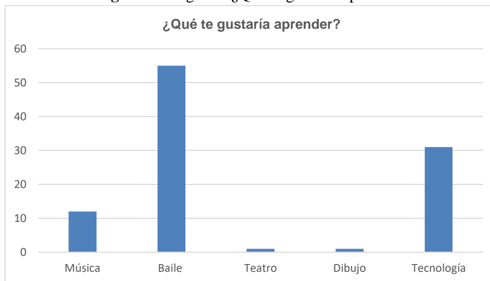
Figura 3. Pregunta: ¿Qué te gustaría aprender?