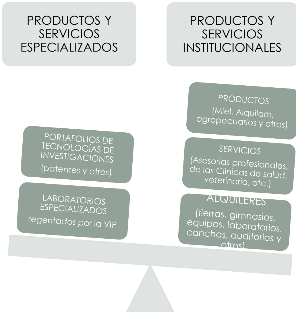
Figura #1 J.