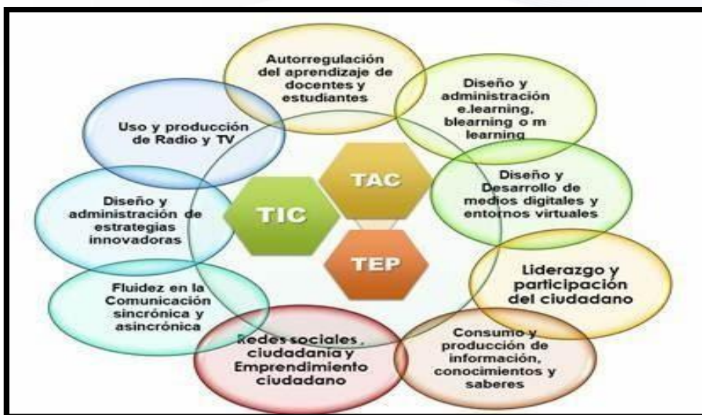
Esquema de las innovaciones en la tecnología educativa