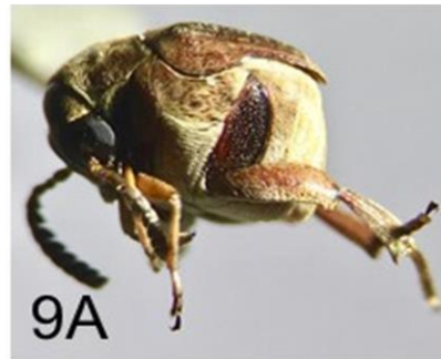
Fig. 9A M. maculiventris (Bruchidae), vista lateral