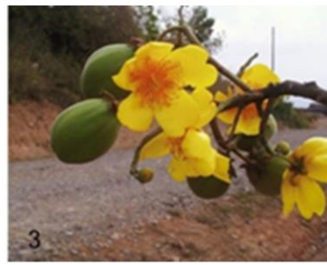
Fig. 3 Fruto verde y flor