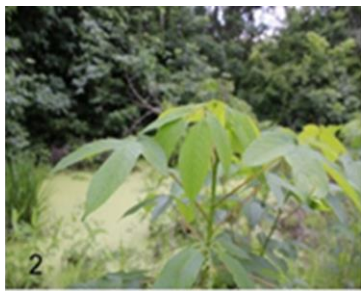
Fig. 2 Hojas del arbusto

Se examinaron un total de 424 semillas en dos frutos de Cochlospermum vitifolium (Willd.) (Plantae: Bixaceae) “poro-poro” (Figs. 2–5) de las cuales se obtuvieron 47 individuos (23 machos, 24 hembras) de Megacerus maculiventris (Coleoptera: Bruchidae) (Fig. 9A) y ocho individuos (7 hembras y un macho) de la avispa parasitoide Stenocorse bruchivora (Crawford) (Hymenoptera: Braconidae). Sin embargo, observando las 424 semillas se contabilizó un total de 72 semillas infestadas por Megacerus maculiventris (Bruchidae) lo que representa el 17% de semillas infestadas por el Bruchidae; posiblemente 25 individuos emergieron antes de la colecta o se escaparon de la cámara de eclosión en el laboratorio (Figs. 6–7). También se pudo contabilizar que de las 72 semillas infestadas con Bruchidae, 8 estaban parasitadas por S. bruchivora , lo que representa el 11.1% de parasitismo (Figs. 8–9B).