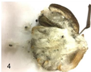
Fig. 4 Fruto seco con semillas sueltas y abundantes fibras blancas que cubren las semillas