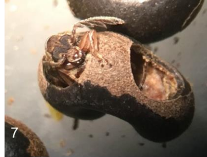
Fig. 7 M. maculiventris emergiendo de semilla de C. vitifolium con dos aberturas