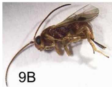
Fig. 9B Stenocorse bruchivora