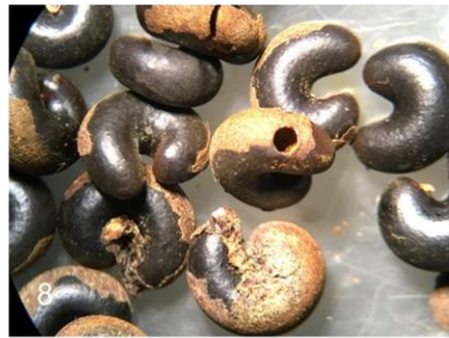
Fig. 8 Abertura, placa chica por donde sale Stenocorse bruchivora (Braconidae)