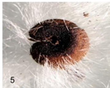
Fig. 5 Semillas secas cubiertas con fibras blancas