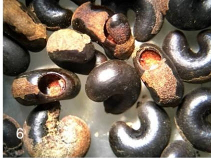
Fig. 6 Abertura de semilla, con y sin cubierta, donde emerge adulto de Megacerus maculiventris