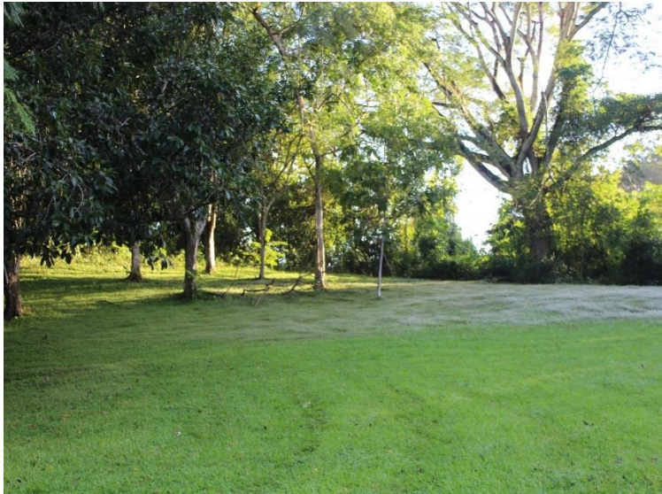
Fig. 1. Sitio de registro de depredación de cecilias por de B. urubitinga .