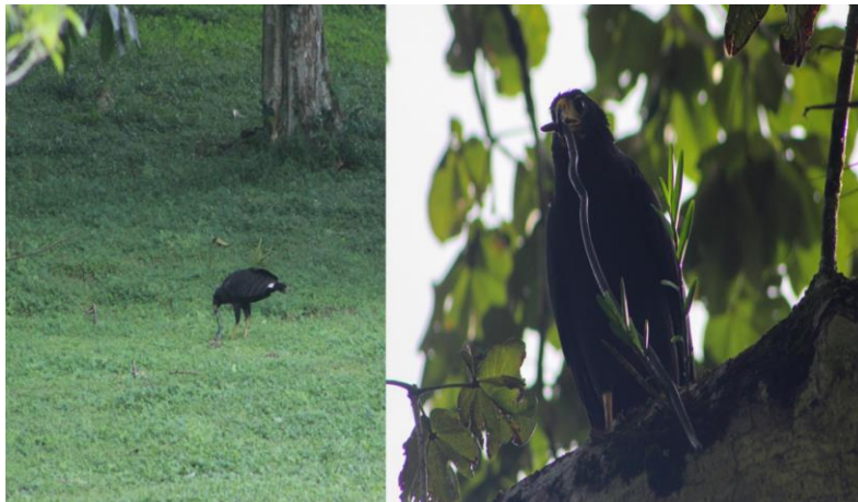
Fig. 2. Observación de secuencia de captura de cecilia por B. urubitinga . A: búsqueda y captura, B: perchado en puntos altos del dosel para alimentación.