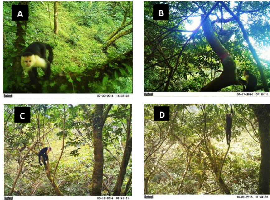
Fig. 3 Registros de cámaras trampa de Cebus imitator en árboles de: A) Sapium pachystachys , B) Inga punctata , C) y D) Schefflera sp. , Finca Doña Amelia. Boquete, Panamá.

Los encuentros visuales, rastros encontrados y resultados obtenidos con cámaras trampa (Fig. 4a), indican una mayor frecuencia de visitas de C. imitator al cafetal durante la estación lluviosa, principalmente entre los meses de mayo a agosto. Los meses que no registraron fotografías fueron diciembre, febrero y abril. Basado en el muestreo con cámaras trampa, el 61% de los eventos independientes se registraron en horario matutino (Fig. 4b). Particularmente, en la época lluviosa se registró un pico de actividad entre las 07:19 y 08:59 horas (DE 07:59±0:35; n=11).