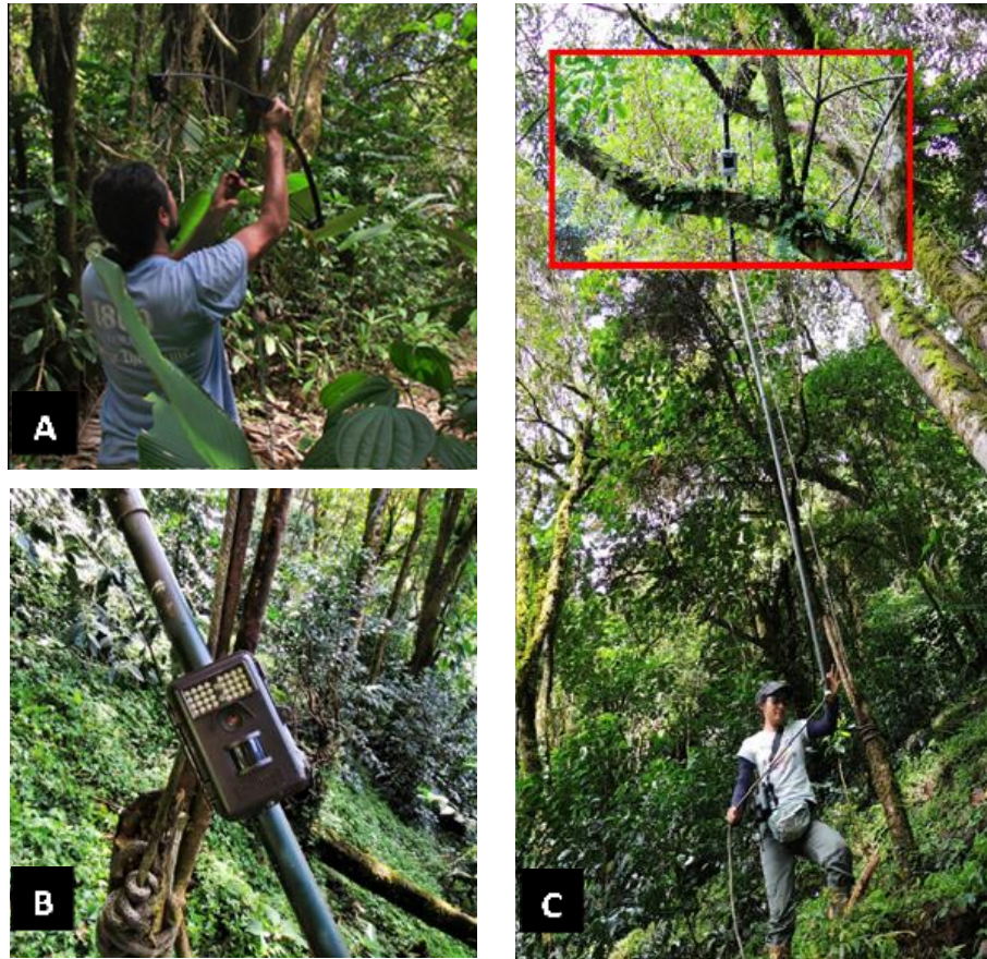
Fig. 2 Para aplicar el SCO A) se dirige una cuerda hacia una rama, utilizando un arco, B) se ata la cámara a un tubo de PVC y C) se unen tantos tubos sean necesarios para alcanzar la altura deseada.

alturas entre los ocho y 10 metros. En cada árbol, se colocó una cámara Bushnell® Trophy Cam™, Modelo 119436 digital, atada a un tubo de PVC de una pulgada de diámetro y dos metros de longitud (Fig. 2). Este tubo se conectó a otros, según la altura de la rama seleccionada para enfocar la cámara, los cuales fueron suspendidos con el uso de una cuerda de 11 mm de diámetro y 30 metros de longitud.