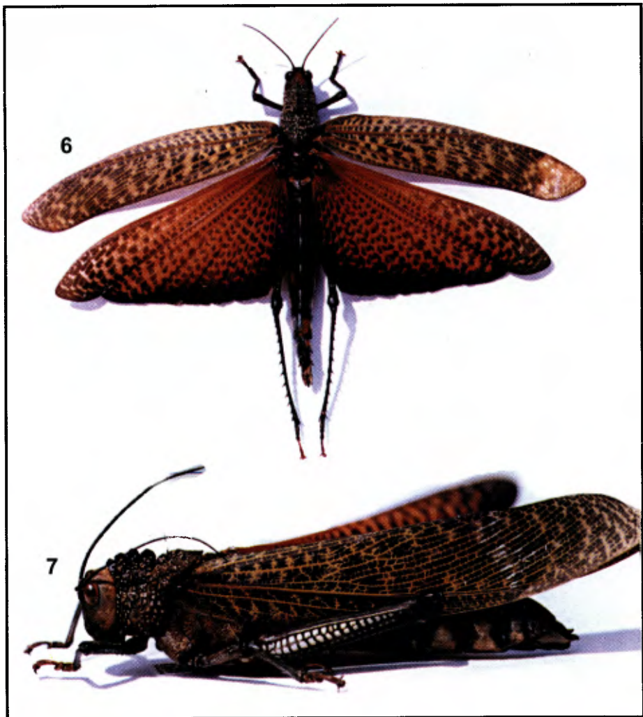
Figs. 6-7. Tropidacris cristata (L.), hembra: 6, vista dorsal, línea: 25.5 mm; 7, vista lateral, línea: 20 mm.