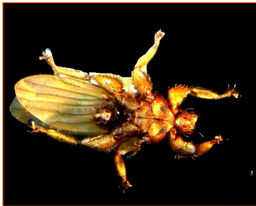
Fig. 5. Paratrichobius salvini , vista ventral.