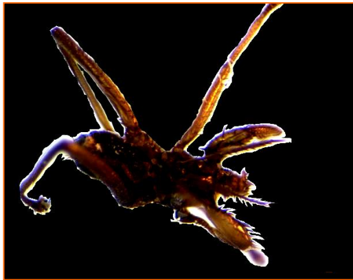
Fig. 4. Neotrichobius stenopterus , vista ventral.