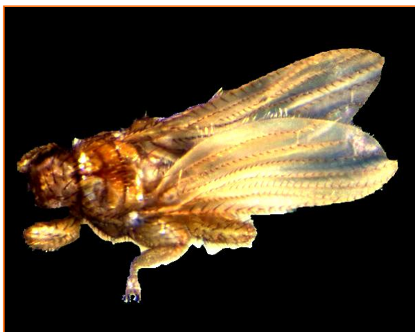
Fig.1. Trichobius joblingi , vista dorsal.