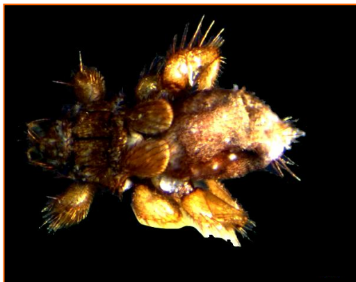
Fig. 6. Aspidoptera delaterrei , vista dorsal.