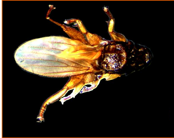
Fig.3. Strebla carolliae , vista dorsal.

En 15 individuos de Artibeus jamaicensis (4♂; 11♀), 12 estaban parasitados (80 %) por 27 individuos de Streblidae, siendo Aspidoptera busckii la más frecuente, con 14 individuos y Metalasmus pseudopterus la menos abundante con tres especímenes. Megistopoda aranea también forma parte de la fauna ectoparásita de A. jamaicensis . En 10 ejemplares de Carollia castanea , de un total de 15 (8♂; 7♀), se encontraron 13 Streblidae. La especie Strebla carolliae fue la más abundante, con siete especímenes, aunque Trichobius joblingi presentó un total de cinco especímenes. Por el otro lado, la especie menos abundante en esta especie de murciélago fue Speiseria ambigua con un sólo espécimen.