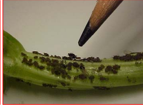
Fig. 1A. Aphis gossypii sobre Cucumis Melo .