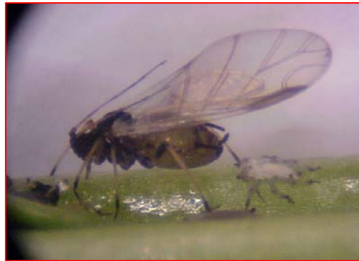
Fig. 3D. Hembra alada adulta de Aphis craccivora .