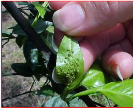
Fig. 3A. Colonia de Aphis spiraecola en cítricos.