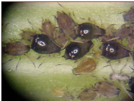
Fig. 1B. Aphis craccivora sobre Vigna unguiculata .