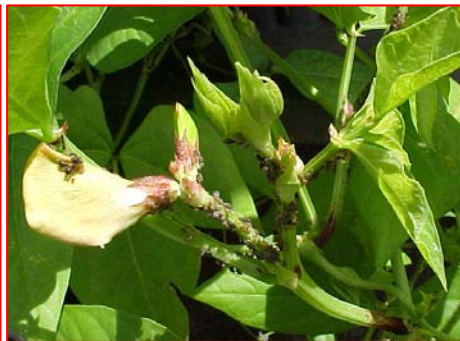
Fig. 1C. Colonias de individuos apteros: adultos y ninfas de Aphis craccivora .