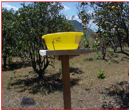
Fig. 2A. Trampa amarilla de agua para capturar áfidos en el campo.

de 75 ml, como envases de cría, tapados con trozos de algodón para permitir la entrada del aire y reducir la condensación. Con el fin de mantener la planta lo más turgente posible dentro del envase de cría, se recortó el extremo basal del tallo envolviéndolo en un algodón húmedo. Estos tubos se verificaron diariamente para colectar adultos tanto ápteros como alados y eliminar todos los depredadores que pudieran haber en la muestra. Más tarde, los tubos de ensayos se reemplazaron por cajas plásticas transparentes (método de Remaudiere, comunicación personal, 1987), cuyas tapas, provistas de ventanas cerradas con “nylon” hicieron más cómodo y fácil el manejo de las muestras, evitando por completo la condensación dentro de la cámara (Fig. 2B). El material obtenido así, se conservó en etanol al 65% en tubos de ensayo de 8 ml cerrados herméticamente con tapones de caucho.