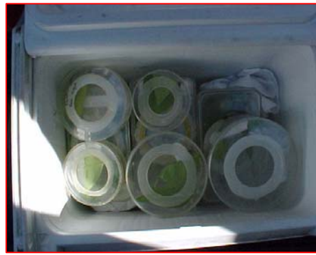
Fig 2B. Cajas plásticas para el transporte y cría de áfidos en el laboratorio.

Todas las identificaciones previas fueron realizadas con la ayuda de un microscopio estereoscópico Wild M5 ® , con un aumento máximo de 100x. Para la identificación de las especies se usaron las claves presentadas por Smith et al. (1963); Holman (1974); Cermeli (1984); Blackman & Eastop (1984), Remaudiere (1985); Voegtlin et al., (2003), además de las descripciones y redesccripciones de las especies. La confirmación y corrección de las identificaciones fue hecha por el Dr. George Remaudiere (Institute Pasteur, Paris), quien a su vez solicitó la corroboración de las identificaciones, en aquellos casos en que lo consideró necesario, a los especialistas en los diferentes géneros