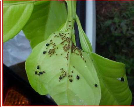
Fig. 3 B. Colonia de adultos ápteros y ninfas de Toxoptera citricida en cítricos.