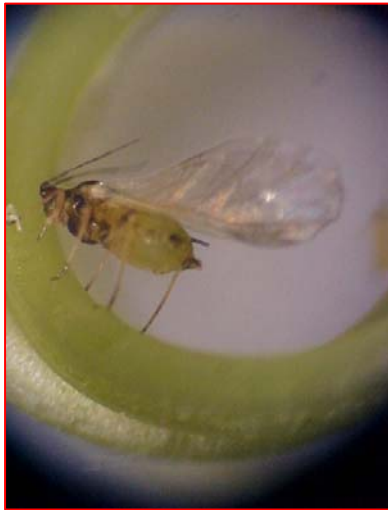
Fig. 3C. Hembra alada adulta de Aphis gossypii .